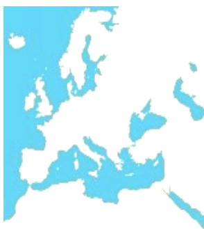
ASSOCIAZIONE MEDITERRANEA DI SOCIOLOGIA DEL TURISMO