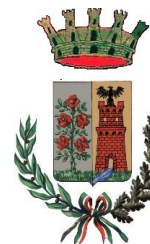
CITTÀ DI ROSARNO